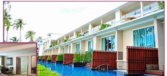
Panwa Duplex Lagoon Suite (Pool Access) <100m 2 >