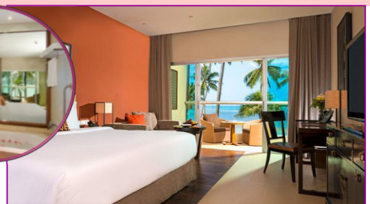
Andaman Sea View Room <42m 2 >